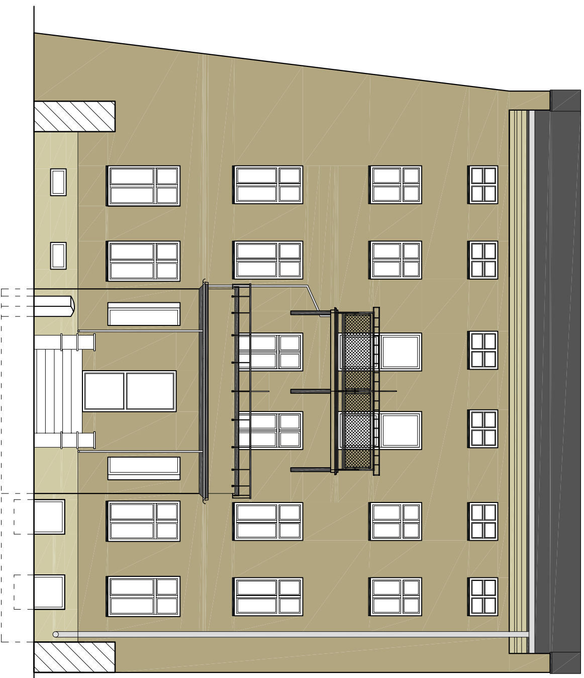
Podwale 79A Elewacja E-4